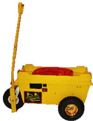
Model 3324RR Locomotive