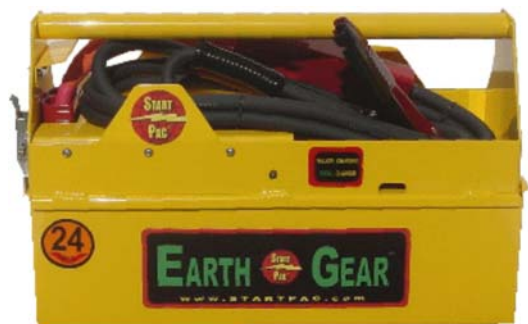
Earth Gear Model 2300QC